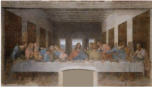
ա. Լևոնտինյան ընթրիք, (1495-1498)

Համապատասխանեցնել նշված արվեստագետներին իրենց աշխատանքներին: Համապատասխան վանդակներում նշել համարները: